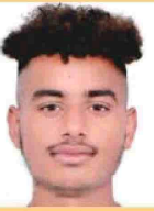
JAGGI B.A. Sem-IV Inter College Winner Senior State 2nd 2023-24