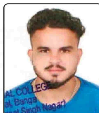
PRINCE B.A. Sem-II Inter College Winner (Captain) Senior State 2nd